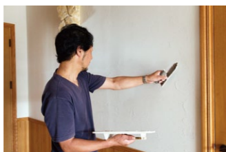
目標の1つだった異業種へのチャレンジとしてスタートした「グリーンズ・カフェ」のランチメニュー(写真右)と、塗り壁や薪ストーブを扱う「夢ファクトリー知床INC」のショールーム(写真中・左)